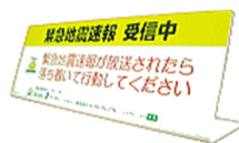
周知広報用スタンド