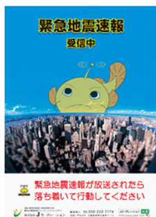
周知広報用ポスター A3 サイズ

また、ご希望のお客さまには、年1回更新用の周知広報用ポスターを無償でお送りいたします。